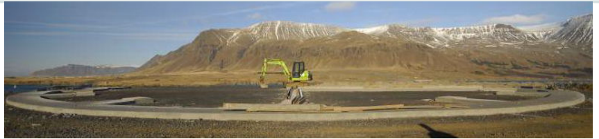
Útsýnið af skeet völlum er rosalegt einsog sjá má af velli 1.