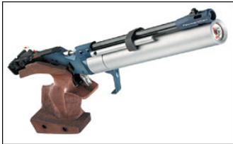
Feinwerkbau P44 Loftskammbyssa einskota til ólympískrar skotfimi af 10 metra fari